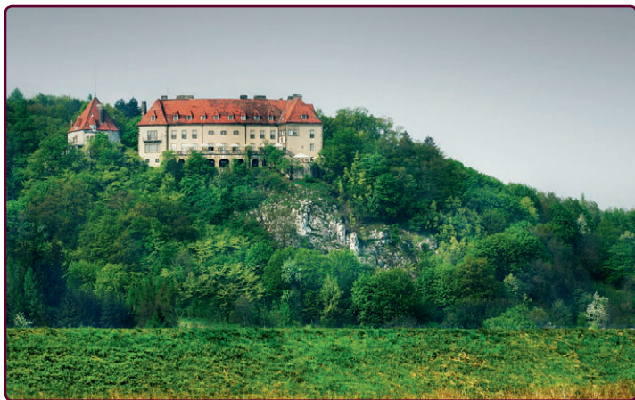
Rezydencja w Przegorzalach

Wznoszący się nieco dalej na zachód klasztór Kamedułów na Bielanych to budowla pochodząca z początków XVII w., związana z niezwykle barwną historią i osobą Mikołaja Wolskiego – marszałka wielkiego koronnego. Jak podaje przekaz z okresu założycielskiego, klasztor miał powstać na terenie należącym do kasztelana Sebastiana Lubomirskiego. Nie był on jednak przychylny budowie i Mikołaj Wolski posłużył się specjalnym fortelem, aby go do tego przekonać. Wolski wyprawił bowiem ucztę, w której udział wzięli najznamienitsi goście i na której publicznie opowiedział o swojej intencji wybudowania kościoła. Lubomirski nie miał w zasadzie wyjścia – wśród patrzących na niego oczu zgodził się na oddanie ziemi, w zamian za co Wolski ofiarował mu niezwykle cenną srebrną zastawę, na której odbywała się uczta. Od materiału, z jakiego ją wykonano pochodzi nazwa miejsca, w którym stanął kościół – Srebrna Góra.